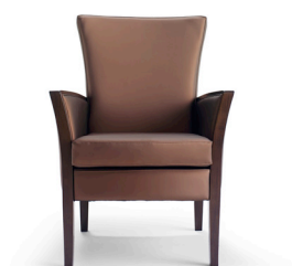
Iris 5201 avec accoudoirs en bois