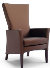
Iris 5101 + 0401 avec dossier haut