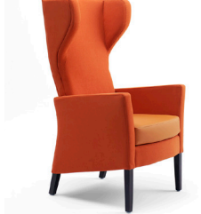
Iris 5101 + 0501 avec dossier haut et appui- tête latéral